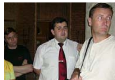
Растущие ряды гендеристов

Растущее год от года число мужчин-участников обнадеживает. Не берусь судить обо всем постсоветском пространстве, но в "КавкАзии" проблема гендерного равенства явно будет решена уже в самом ближайшем будущем".