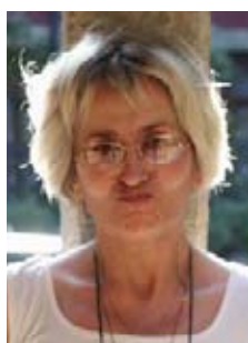
Редактура, дизайн и верстка: Галина Петриашвили