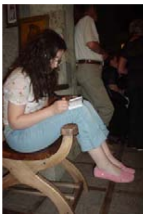
И вообще, подумать было о чем