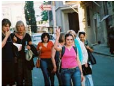
Наше дело правое, и победа будет за нами

Третья Международная Конференция Журналистов