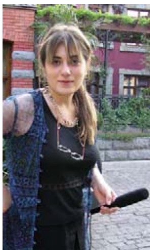
...взять пару-тройку интервью