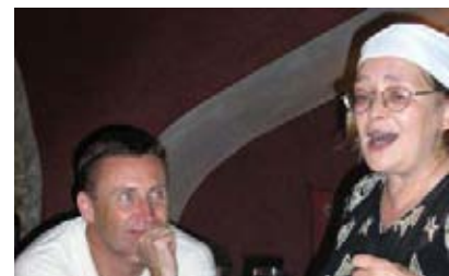
...и аудиторию, которая просто заслушивается твоей речью