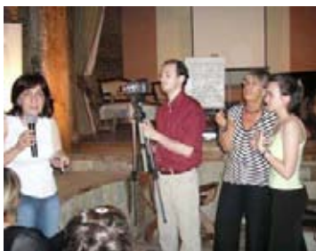
Мы по традиции снимаем фильм. Третий фильм про Третью конференцию