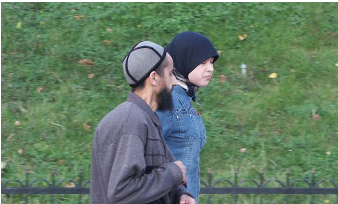
фото У. Ахмедовой, Узбекистан

А потом - как у абсолютного большинства наших женщин: замужество, дети, муж. И неважно, любимый или нелюбимый. О работе вне дома, о работе по профессии речи, как правило, нет. Но даже если выпускница этого престижного вуза и начнет работать, пресловутая скромность вряд ли поможет ей сделать хорошую карьеру.