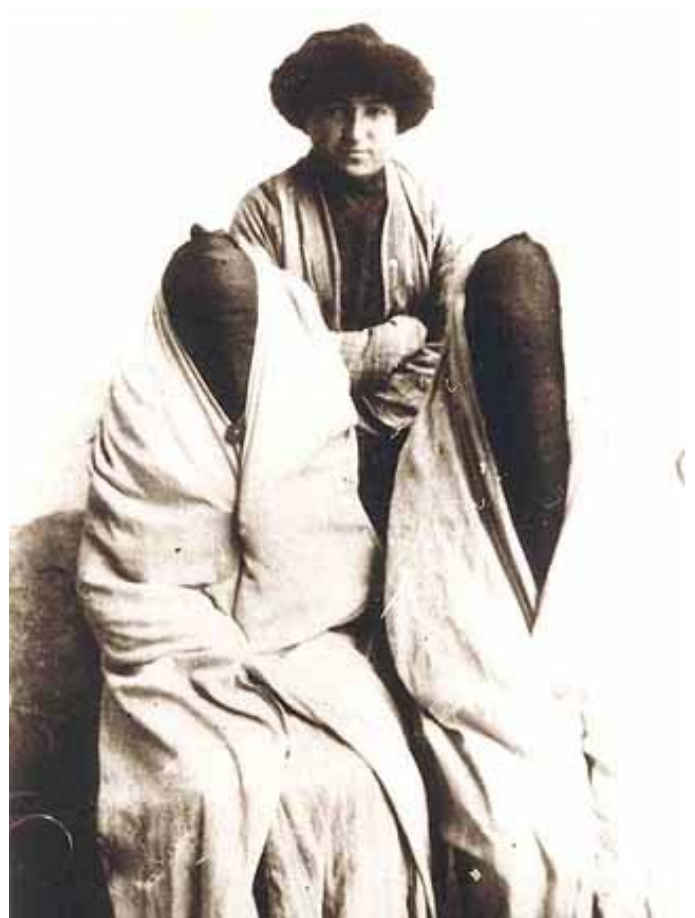
начало 20 века

Пока еще можно, нужно бороться. Но далеко не все ощутили эту угрозу. Проблема еще и в том, что невозможно открыто выступить с критикой. Как, скажут многие, она против наших традиций? Она, дочь таких-то родителей, наплевала на наши обычаи, раскритиковала ислам? Хотя ислам никто критиковать не собирается, но пусть религия решает свои проблемы и действует своими методами, - а у государства должны быть свои. Это не должно смешиваться! И государство должно защищать мои гражданские права независимо от того, какой хочет видеть меня религия.