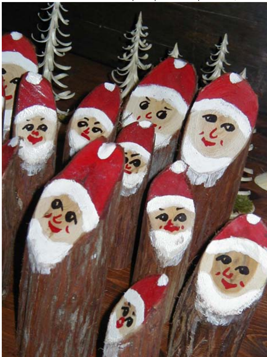
фото-привет от Харды Роосна, Эстония

МЕЖДУНАРОДНАЯ КОАЛИЦИЯ КавКАзия и АССОЦИАЦИЯ ЖУРНАЛИСТОВ ГендерМедиаКавказ