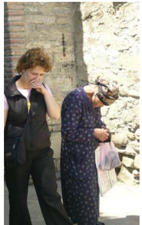
фото Галины Петриашвили, Грузия