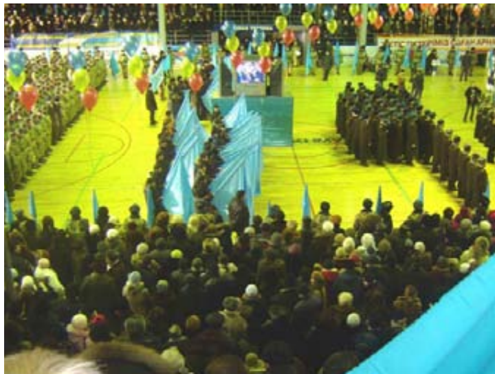
фото Сауле Майлибаевой, Казахстан