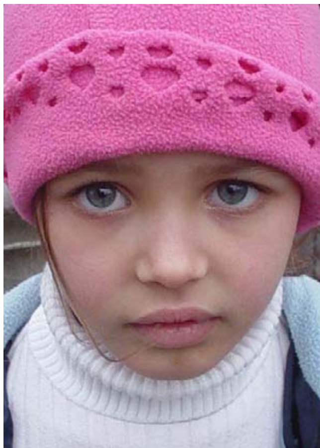
Пышные оборки не отменяют умную головку и сильный характер.

А вот фильм "Три орешка для Золушки" - более приемлемый вариант. Она там и стреляет первоклассно. И посмеивается над недотепистыми мужчинками. И умеет дружить и защищать. И на язычок остра. В общем, наш человек. Хоть и сирота, но не плакса.