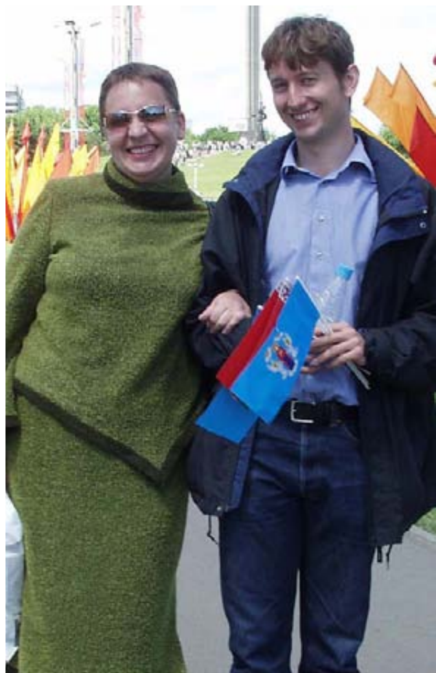
Всем спасибо, мы как-нибудь разберемся сами.

По роду деятельности мне пришлось довольно долгое время консультировать молодых шведов, приезжавших в Беларусь. Обсуждая проблемы, мы гуляли по городу, заходили в кафе. Еще не было ни Декрета, ни Постановления. Но уже тогда мне довелось явственно почувствовать отеческий пригляд родного государства. Что же будет, если желание регулировать личную жизнь граждан станет легитимным?!