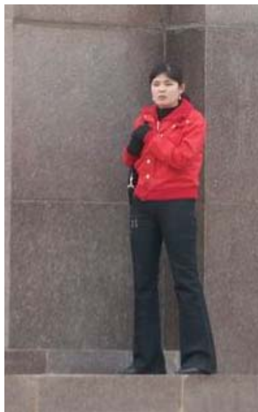
Закон против насилия и Национальный план - будет ли работать все это, если самооценка женщины останется прежней? фото Умиды Ахмедовой, Узбекистан

Да, все это есть. Но... Будет ли это работать, если женщины сохраняют в себе прежнее отношение к этой проблеме? Если в каждой не проснется достоинство? Я не знаю, как сложится жизнь этой студентки. Но надеюсь, что она уже будет не такой, как у ее мамы. Свою жизнь она хочет построить сама и без насилия. Меня радует, что сегодня у моих студентов совсем другое самосознание, чем у их родителей. Особенно у девушек. Они надеются на будущее, строят грандиозные планы, интересуются политикой и пытаются принимать в ней участие. Главное, для многих кыргызских девушек характерно стремление добиваться независимости. А это - лучшая прививка против дискриминации.