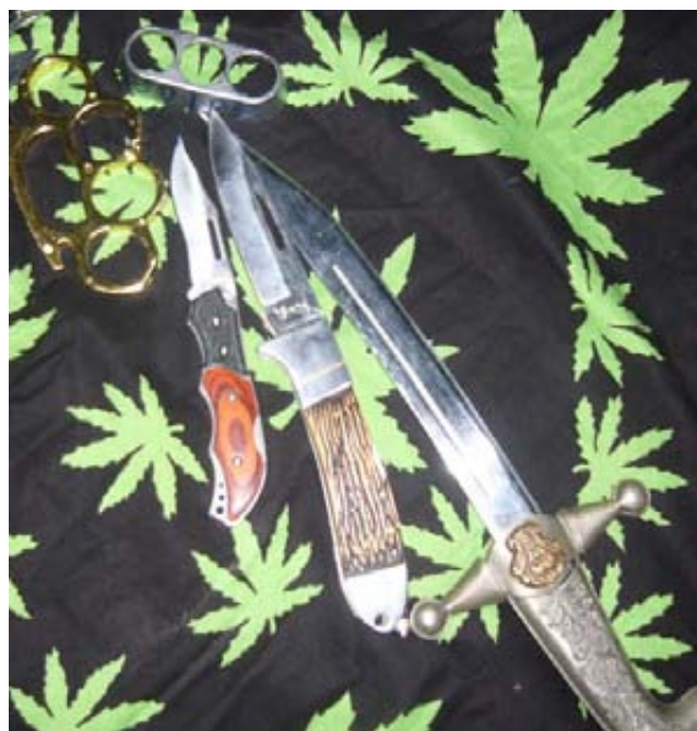
Ножи и кастеты не обязательны, если вы имеете дело с женщиной, - достаточно пригрозить ей расправой над ребенком.

(банальной кражи), ключи от квартиры ей не вернули и позвонить дочери не дали. Другая женщина рассказала мне о том, что подписала, не читая, протокол допроса после всего лишь "сообщения" о том, что сотрудникам милиции известно, в какой школе учится ее 8-летний сын, и что забрать его оттуда не составит для них никакого труда. Многие упоминают о том, что, угрожая матери большим сроком заключения в случае отсутствия "чистосердечного признания", следователи подолгу и с удовольствием описывали будущие страдания ребенка, который будет отправлен в детдом. Таких примеров бесконечное множество. Разнообразие и изощренность видов психического насилия, применяемого к женщинам (сопутствующее физическое насилие и условия содержания под стражей - отдельные темы), заставляют задуматься о моральном облике людей, которые призваны охранять наши права. При том, что все виды насилия по отношению к подсудимым являются неприемлемыми вне всякой зависимости от гендерной принадлежности, манипулировать чувствами матери, жены, дочери, сестры - как минимум, неимоверно жестоко. Хуже всего, что подобные вещи давно рассматриваются как сами собой разумеющиеся, они не выражают отношение сотрудников милиции к подсудимым, являются просто частью их ежедневной работы и устоявшейся практики. Мысль о ее порочности представителям "органов" как-то не очень приходит в голову.