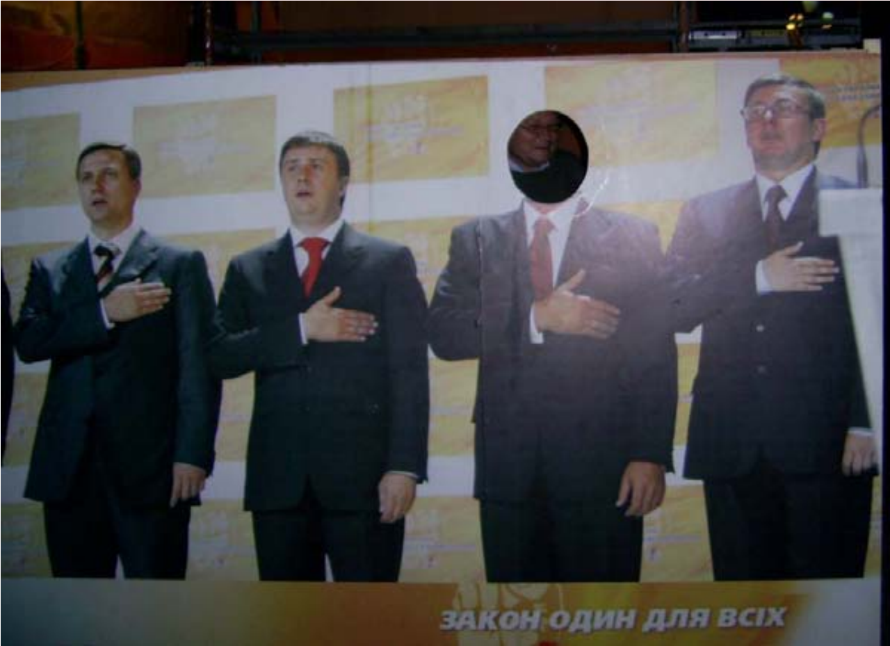
...игра для начинающих политиков - "Построй свою коалицию"

Стали известны результаты внеочередных парламентских выборов в Украине. Новоизбранная Верховная Рада обречена на расбалансированность - вне всякого сомнения, что гендерный дисбаланс отзовется в ее работе. Предварительные подсчеты показывают, что и без того низкое представительство женщин еще уменьшилось. Такая вот ориентация на европейские тенденции! Из 450 мест - только 34 будут принадлежать женщинам (в предыдущем составе у них было хотя бы 38 мандатов).