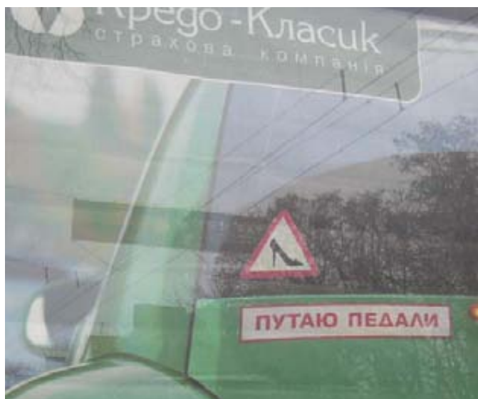
А этот сексистский юмор на большой дороге - просто бессильная зависть конкурентов...

(авто) в данном случае - вне подозрений. Озабоченные собственным репутацией мужа приглашают даму за рулем для обслуживания жен. Подгулявшего на банкете господина товарищи отправляют домой на специально заказанной машине с шофером-женщиной и с наилучшими пожеланиями. Когда водитель мужчина, ничего особенного не пожелаешь, да и номер машины на всякий случай спешат записать. Справедливости ради следует заметить, девушки за рулем оказывают исключительно транспортные услуги. Та же справедливость не позволяет умолчать о том, что они, захватывая место под солнцем, слегка демпингуют. Но упрекнуть за это их нельзя. Традиция оплачивать женский труд по более низким расценкам, чем мужской, сохраняется вопреки всем парадоксам. Автономное предприятие, покинувшее создателя, характеризуется следующими недостатками. Дамы используют частные автомобили, амортизация не просчитана. Корпоративное обслуживание в автосервисе не организовано. Поддержание средства производства в рабочем состоянии лежит на мужьях. То есть используется неучтенный, неоплачиваемый и зачастую неквалифицированный труд. За счет этого труда получается у девушек более высокая, чем в рамках прежней фирмы, зарплата. Но это - фикция. Серьезная экономика таких огрехов не терпит. Так что, между нами, девочками, говоря, надо учиться и поскорее переходить из категории дилетантов в класс профи.