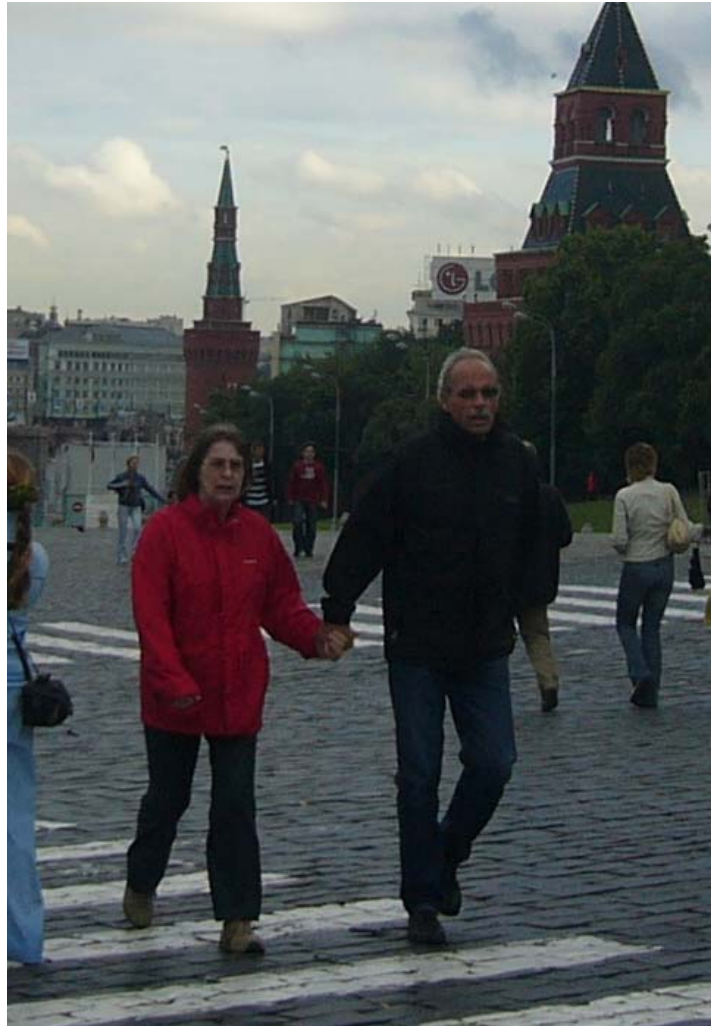
...хороший муж помнит, что он держит за руку целый штат: домашнего менеджера, повара, няню и воспитательницу, дизайнера, психолога, медсестру, а порой еще слесаря и электрика

только в такие "сверхурочные" часы и общаются со своими чадами. Поэтому их виртуальный заработок логично оценить из расчета $10 за час - в месяц получается как минимум $2000. А если приплюсовать готовку и уборку, то домашние хлопоты для них стоят $3300-3500 в месяц. Это хорошая зарплата, но при ее расчете и для домохозяйки, и для работающих женщин мы не учитывали массу других обязанностей, которые на самом деле им приходится выполнять.