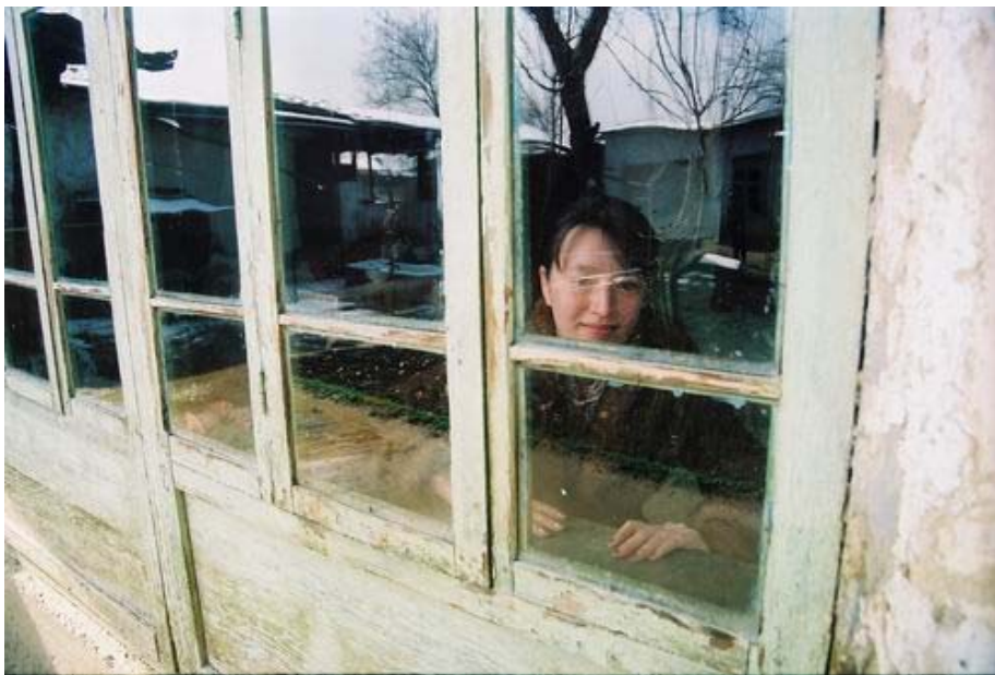
გალიაში დარჩე თუ თავისუფლად შეინავარლო – შენი გადასაწყვეტია