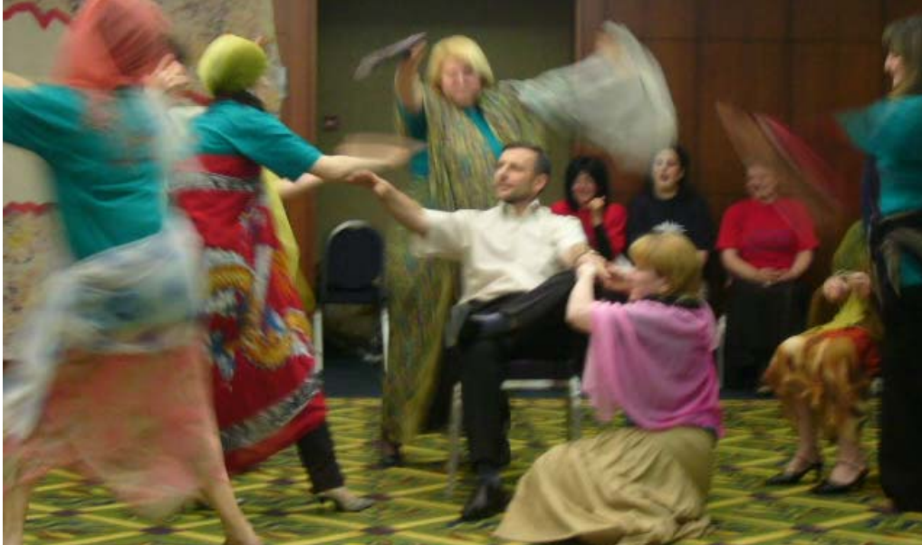
დეპუტატს ერთი ცოლი ჯერ სავსებით აკმაყოფილებს, მაგრამ იმათზე ზრუნავს, ვისაც ეცოტავება