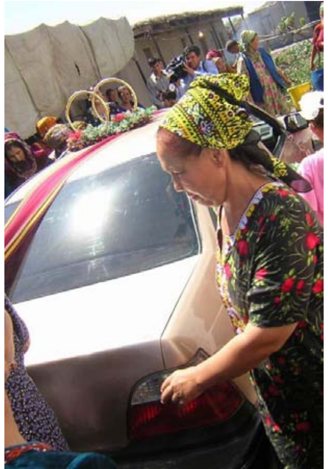
ყოველთვის და ყველასთვის კი არ არის ქორწილი მხიარული დღესასწაული...

– მერე, მისი მშობლები, როგორ შეხვდნენ ამას? – ვკითხე მოსმენილით შეძრულმა.