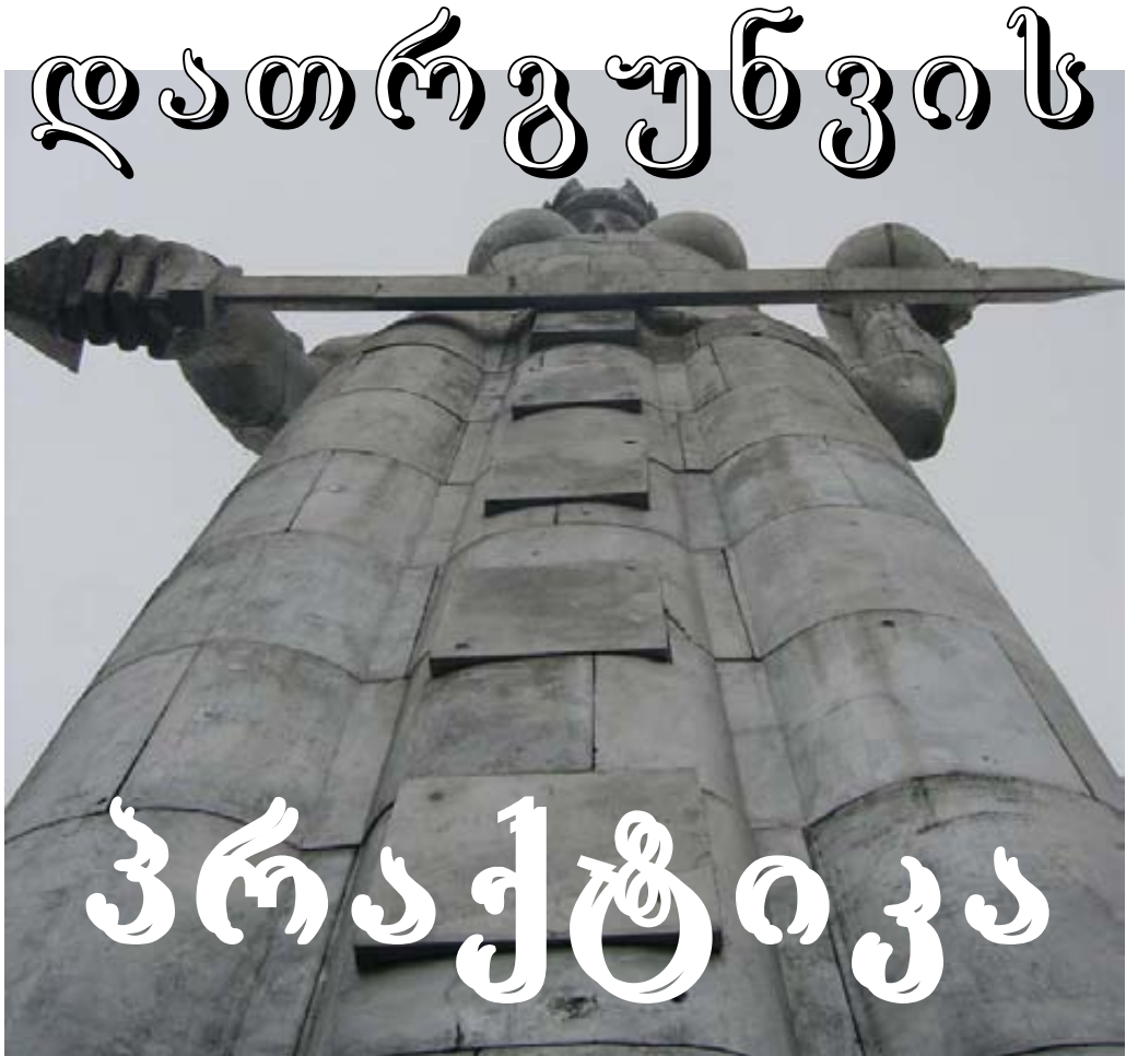
ფოტო პოლინა მილორადოვიჩისა, საქართველო