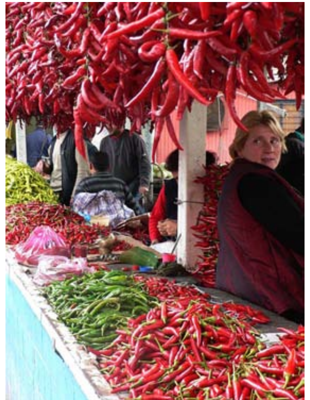
წითელ პილპილზე უარესი სიმწარე არსებობს ღღეს საქართველოში

ჩვენ ხურდას ვუყვართ და პირს ვიბრუნებთ, გვავიწყდება, რომ ეს ჩვენი ბავშვებია. და რომ სინამდვილეში ისინი ძალიან გვიყვარს... ჩვენი ქვეყანა, ჩვენი სახელმწიფო, ჩვენი ერი ვერ გახდება ძლიერი და ერთიანი მანამ, სანამ ჩვენი ბავშვები ბედნიერები არ გახდებიან, მოხუცები კი – მაძირები. რამდენიც არ უნდა ისაუბრონ ნატო-ში ინტეგრაციაზე.