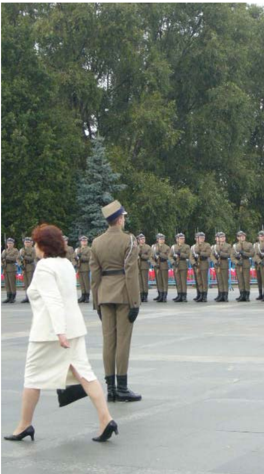
„კონტინგენტი“ ასე იოლად ვერ ჯდება საერთო ხედში და „ხმას ფეხებით აძლევს“ ფოტო პოლინა მილორადოვიჩისა, საქართველო