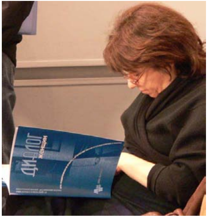
საბედნიეროდ, ყველა ჟურნალი როდია ინტელექტუალური გილიოტინა. ყურადღება: მეგობრული გამოცემის ირიბი რეკლამა!

თითქოს სულაც არ არის ძნელი, ადგე და თქვა: „მე ეს გაზეთი არ მჭირდება და ფულის გადაყრას არ ვაპირებ“. თუ ხელმძღვანელობა თავისას არ მოიშლის, ფორმალური საფუძველი მოვითხოვთ: ფორმალური სამსახურებრივი ბრძანება ან განკარგულება. ხომ ცხადია, რომ ასეთი არ არსებობს. თავის დროზე ასე მოვიქცევი და მე თავი დამანებეს, მაგრამ ცოტამ თუ მომბაძა და როცა სკოლის დატოვება გადავწყვიტე, ხელმძღვანელობამ შვებით ამოისუნთქა.