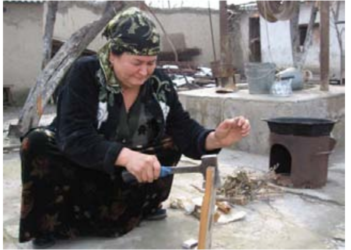
ყოველდღიურ ბენდიერებაში შესვენებებიც ხდება და მამინ შემასა და ღუმელს უნდა მიხედო

თქვენ ამ პირობებში ცხოვრობთ და უკვე ვეღარც კი იხსენებთ, ბოლოს როდის უყურეთ ტელევიზორს ან როდის ჩართეთ მაცივარი, რადგან ბენდიერებისათვის გამოყოფილ იმ 45 წუთში უნდა მოასწოროთ საჭმლის მომზადება, ჩაისა და მღუღარე წყლის მომარაგება, ჭამა და დალაგება და თუ გაგიმართლებთ – დაბანაც. თუმცა, ეს – თუ ძალიან გაგიმართლებთ.