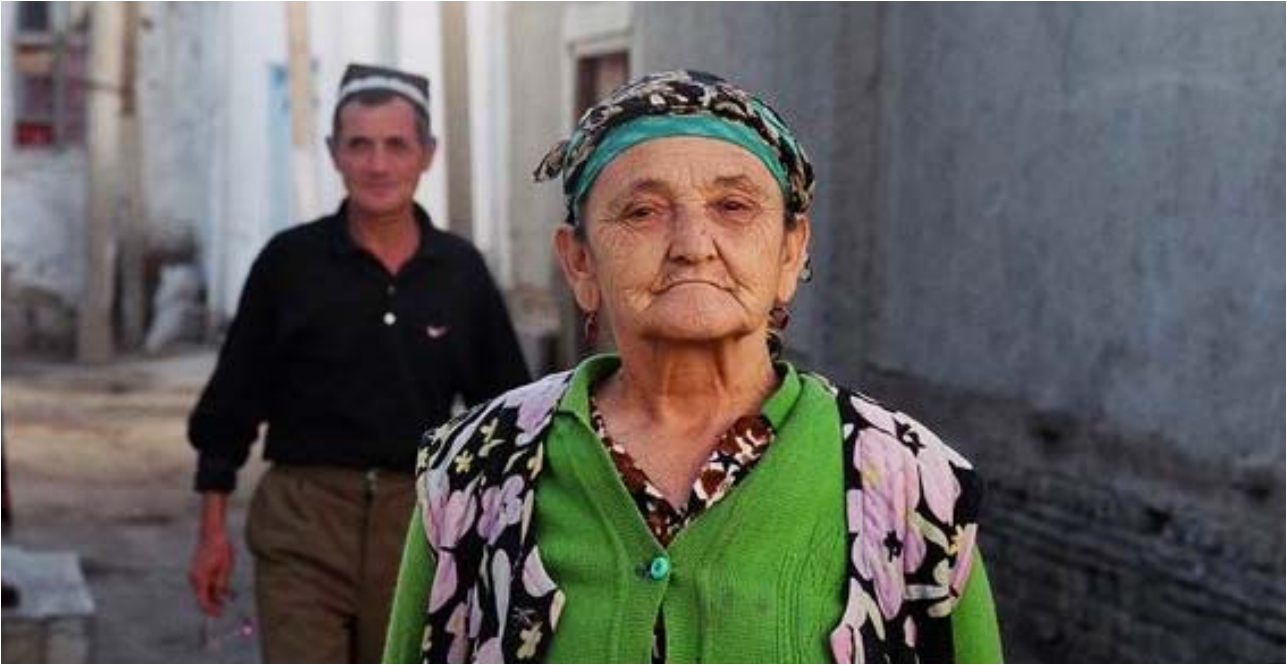
ფოტო უშიდა ახმდლოვასი, უზბეკეთი