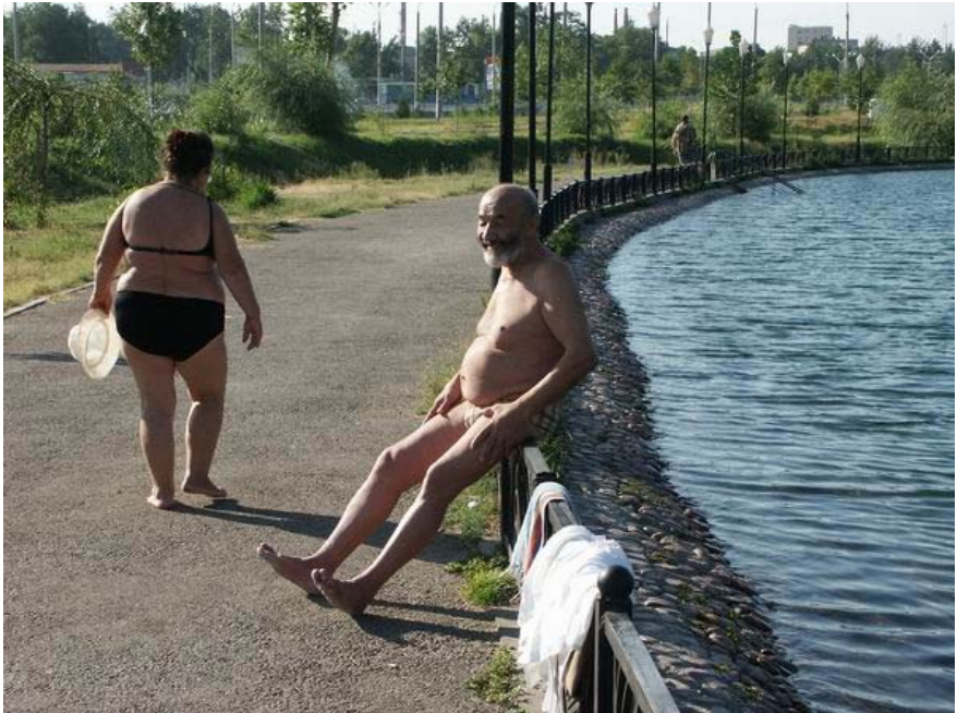
როცა სქესი უკვე არ გალღვებს, შეიძლება გენდერშიც გაერკვე-ფოტო უმიდა ახმელოვასი, უზბეკეთი