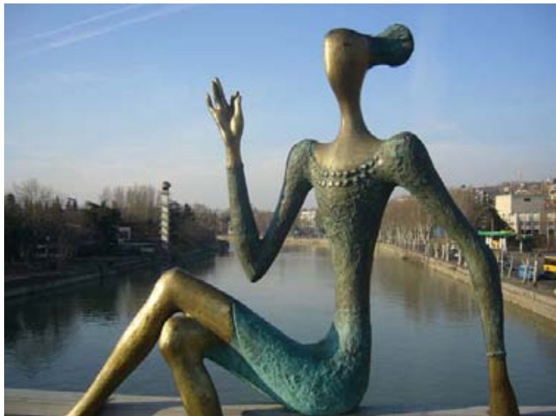
порой мы кажемся себе железными, но это - большое заблуждение

"ВТОРОЙ ПОЛ" НЕ ПОЗВОЛЯЕТ СЕБЕ БЫТЬ СЛАБЫМ