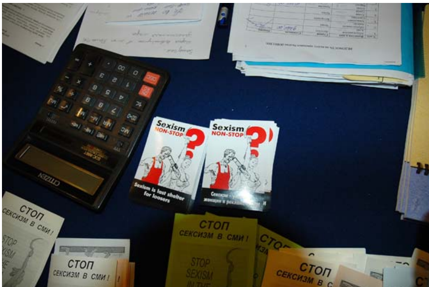
გადაითვალეს და – ცრემლი მოერიათ. მერე?

ყოველდღიურ პრაქტიკაში მის- ის ხელმძღვანელები და ჟურნალისტები იშვიათად ფიქრობენ გენდერულ ბალანსზე. გენდერული მგრძობელობა იმ გამოცემებსაც კი არ აწუხებთ, რომელთა სათავეში ქალები დგანან. ზაგრებში GMMP-ს ჯგუფების ხელმძღვანელთა ევროპულ შეხვედრაზე მიმავალმა თვითმფრინავში ostimees-ი გავიყოლე, ერთ-ერთი გაზეთი, რომლის მონიტორინგსაც ვაწარმოებდით. პირველ გვერდზე იმ დღეს 6 ფოტოსურათი იყო. ქალი – არც ერთზე! გამოცემის რედაქტორი – ქალია. მაშ, გამოდის, რომ მონიტორინგი, კვლევის კარგი ტექნოლოგია ყველაფერი როდია. საჭიროა გულმოდგინე პრაქტიკული მუშაობა, რათა არა მარტო მივაწვდინოთ შედეგები მათ, ვისაც ჯერ არს, არამედ გამოვიყენოთ, როგორც დარწმუნების საშუალება. ეს კი უკვე – ცალკე მეცნიერებაა.