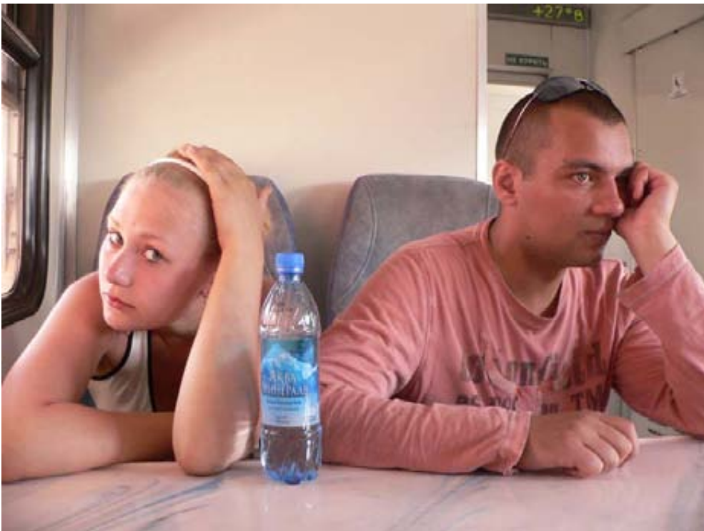
ცხადია, რომ ახალგაზრდობა გენდერული სულისკვეთებით უნდა აღვზარდოთ! ისიც ნათელია, რომ გოგონები ამ აღზრდას მეტი გულისყურით ეკიდებიან...

თუმცა, ცხოვრების პატრიარქალურ ნორმებს ხარისხობრივად ახალი ურთიერთობები ენაცვლება, რომელთა საფუძველსაც პიროვნების თავისუფალი განვითარება წარმოადგენს. დღევანდელ ახალგაზრდობას სხვა სამყაროში უწევს ცხოვრება. იგი უკვე აქტიურად უნდა მოვამზადოთ – ცვლილებები რომ ჰარმონიული იყოს და კონფლიქტებამდე არ მიგვიყვანოს. ვფიქრობ, ჩვენს ქვეყანას ძალიან ჭირდება საღი ახალგაზრდული პოლიტიკა, სადაც მნიშვნელოვან როლს თამაშობს გენდერული თანასწორობა. ეს ხომ საზოგადოების მომავალში გაჭრავს.