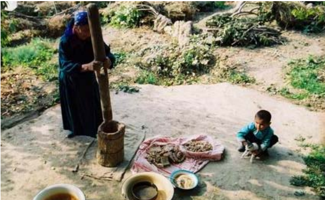
მინდვრის შემდეგ – საოჯახო საქმეები. იგი არავის ჩამოურთმევია

ნაკლებად მისაწვდომია სასოფლო მინდვრებში, ხალიჩების ფაბრიკების საამქროებში მომუშავე, ქალაქის მტვრიანი ქუჩების მხვეტავი ქალებისათვის... გრანტებით ჩატარებული სემინარები და ტრენინგები უბრალო მშრომელი ქალებისათვის ფანტასტიკის სფეროა. მათთვის გინეკოლოგიების, სტომატოლოგიების, სხვა სპეციალისტების ჩამოყვანა სოფელში ან საწარმოში და ქალების გამოკვლევა - აი, რა იქნებოდა რეალური დახმარება! თხუთმეტობდე წლის წინ ერთი გენდერული პროექტით უფროსკლასელებს და ახალგაზრდა ქალებს პირადი ჰიგიენის წესები ასწავლეს, ატარებდნენ სემინარებს ყველაზე შორეულ სოფლებში გასვლით, ბოლოს კი ყველას ჰიგიენური საშუალებების ნაკრები უსახსოვრეს. დღეს ეს მოსწავლეები 30-ს გადაშორდნენ, მაგრამ დღემდე მაღლიერებით იგონებენ იმ სემინარებს... გენდერი! მის შესახებ თურქმენეთში ბევრს არც კი სმენია. თურქმენეთის ქალთა კავშირის ადგილობრივი განყოფილების ჩინოვნიკი ქალი კითხვაზე, რა გენდერული პრობლემების გადაჭრა უხდება მას თავის ორგანიზაციაში, დიდხანს ჩაფიქრდა. და რაც ყველაზე მთავარია, ბოლოს თქვა, ის, რომ ყველა ქალი კითხულობდეს რუხნამს (ყოფილი პრეზიდენტის, ს.ნიაზოვის დაწერილი ორტომეული, რომელიც ყველა თურქმენის სულიერების კოდექსად ითვლება) – ამ წიგნში ნებისმიერ კითხვაზე პასუხი! კომენტარი საჭიროა?