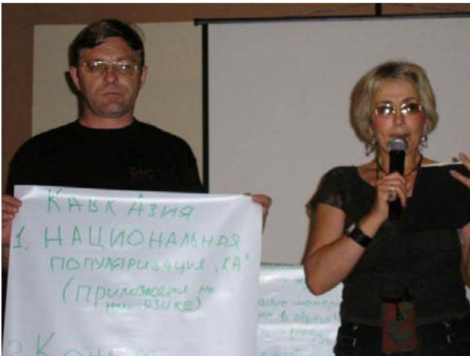
„კავკაზ“ + „მ“ = „კავკაზია“?

მხურვალედ მჯერა ნაყოფიერი თანამშრომლობისა!