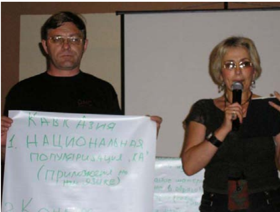
"КавкАз" + "Я" = "КавкАзия"?

Я горячо верю в плодотворное сотрудничество!