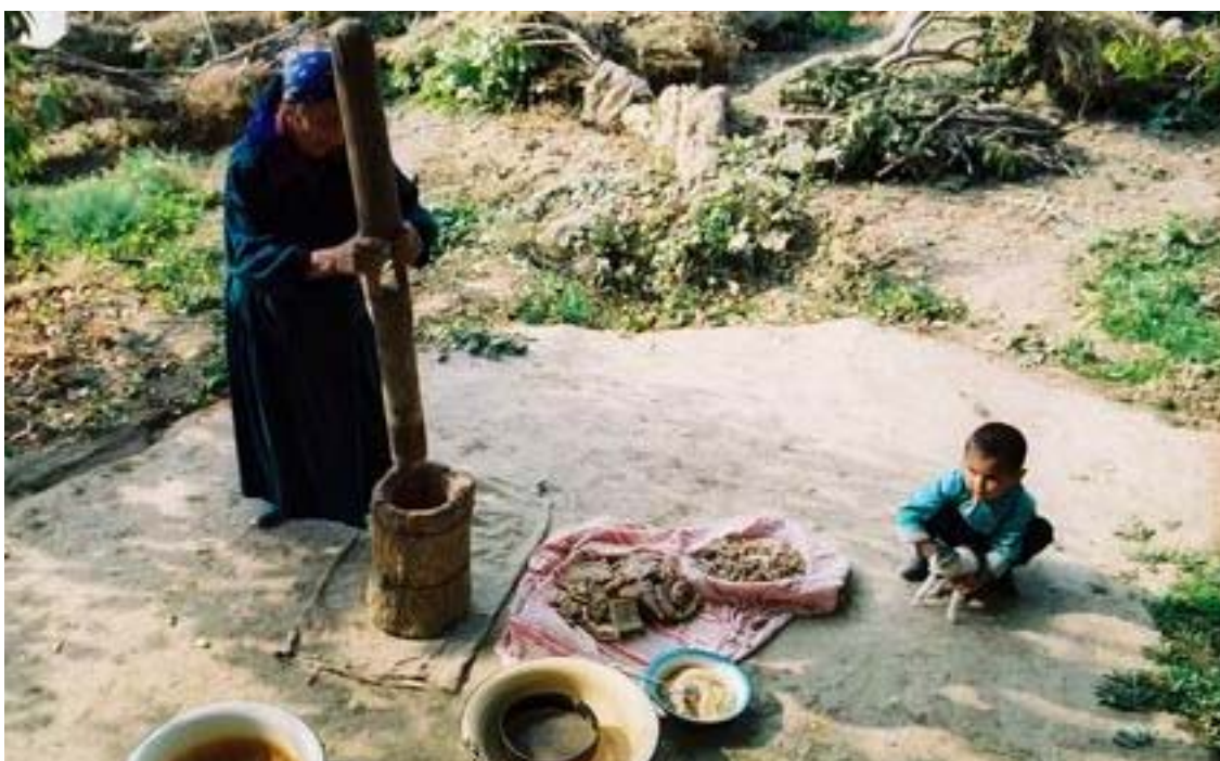
после поля - домашняя работа, ее никто не отменял