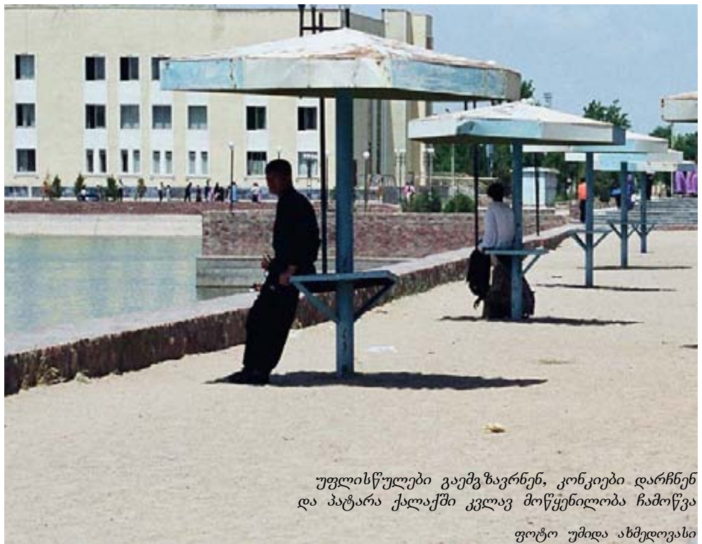
უფლისწულები გაემგზავრნენ, კონკიები დარჩნენ და პატარა ქალაქში კვლავ მოწყენილობა ჩამოწვა

თერმეზი, მიუხედავად ზაფხულის საშინელი სეზონისა და ქვიშის „ავღანელებისა“ (ავღანეთიდან მქროლავი ქარი), გერმანელებს სულ უფრო მეტად მოსწონდათ. მიუხედავად პუნქტებისა შრომით კონტრაქტში, რომლებიც ადგილობრივ ქალებთან სასიყვარულო ურთიერთობების გაბმას კრძალავდა, ცოტამ თუ გაუძლო ამ ცდუნებას. გოგონებიც, რომლებსაც ოკუპირებული ჰქონდათ რესტორნები და ღამის ბარები, ჩვეულების წინააღმდეგ, ძალზე აქტიურები