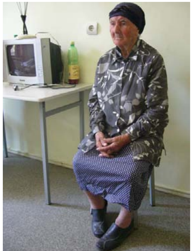
რომ არა მდიდარი თანამემამულის ქველმოქმედება, ამ ბებოს შორეული სოფლიდან ჩვენს ჯანდაცვაში არავითარი შანსი არ ექნებოდა

ოცნებას ხომ არავინ გვიშლის. ჰუმანური ხელისუფლება გლეხებსაც ჭირდებათ, ყურნალისტებსაც, სოფელშიც და ქალაქშიც.