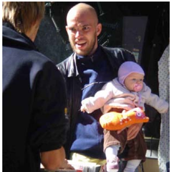
დანიელ მამებს არა მარტო ფეხბურთსა და პოლიტიკაზე უყვართ საუბარი, არამედ პატარებზეც

მაინც რა უბიძგებს საწყალ ქალებს „ევროპაზე გათხოვებისკენ“? მე ეკონომიურ სტიმულზე არ ვსაუბრობ. უცხოელს რომ გაჰყვე ცოლად, გარკვეული სტატუსი და საშუალებები უნდა გქონდეს. დანიაში ჩემი 3 წლის ცხოვრების მანძილზე 200-ზე მეტ „რუს ცოლს“ შევხვდი, მაგრამ არც ერთ – მწველავს, პროფტექნიკური სასწავლებლის კურსდამთავრებულს ან უბრალო გოგოს აულიდან. როგორც წესი, ეს 30-40 წლის ქალები არიან, უმაღლესი განათლებით, ბევრს შვილი ჰყავს პირველი ქორწინებიდან. შეხვედრილებს შორის ბევრია მოსკოვიდან, სანკტ-