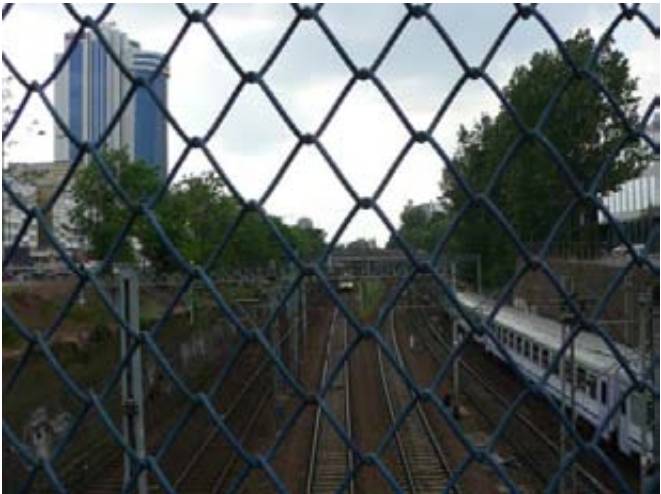
დედაქალაქები ცდილობენ ღობით გამოეყონ თავის პროვინციებს. ამასთან გულუბრყვილოდ სწამთ, რომ ყველაფერი მოწინავე და გონიერი – ღობის შიგნითაა...

ვიღაცამ ფემინისტური ჟურნალი „პრობრაჟენიე“ მირჩია. მოვიძიე ინტერნეტში, იგი თითქოს ფლოსიფიური ხასიათის ჟურნალია, მასში სამეცნიერო სტატიებს ბეჭდავენ. ანუ, ისევ ჩემთვის, უბრალო რუსი, კანტორის ქალისთვის განკუთვნილი არ არის. მაინც რა მინდა მე? მინდა ისეთი ქალების შესახებ წავიკითხო, როგორც მე თვითონ ვარ. კი ბატონო, წარმატებულის, მაგრამ როცა ეს წარმატება ჩემნაირ პირობებშია მიღწეული (არა მოსკოვში და არა პიტერში). ან არც ძალიან წარმატებულის, მაგრამ რომლებიც თავიანთი პრობლემების გადაჭრის გზებს ეძებენ და პოულობენ. დაე, მდიდარი გმირების და იმ გმირების რიცხვი, რომლებიც საშუალო ქალურ ხელფასზე ცხოვრობენ (რას იზამ, იგი მამაკაცის ხელფასისაგან განსხვავდება) საზოგადოებაში რეალურად არსებული თანაფარდობის პროპორციული იყოს. მინდა, რომ იქ მამაკაცებისთვისაც იყოს სტატიები: ისინიც ხომ უნდა დავარწმუნოთ, რომ უნიტაზის წმენდა და სადილის მომზადება – ეს ქალის დანიშნულება როდია. მინდა მასწავლებელ, ექიმ, ბუღალტერ, რაიონული გაზეთების ჟურნალისტ, იურისტ, მზარეულ ქალებზე წავიკითხო. მოდის შესახებაც მინდა! მაგრამ სხვადასხვა ასაკისა და გარეგნობის. არც რეცეპტების საწინააღმდეგო მაქვს რაიმე, მაგრამ ისეთების, რომელთათვისაც ყველაფერი შეიძლება უახლოეს მალაზიაში იყიდო. პოლემიკაც იყოს, მაგრამ არა იმაზე, როგორ გამოვიჭიროთ კაცი... განა ბევრი მინდა? კარგი იქნებოდა, ცენტრალურ ჟურნალებს უბრალო ჭეშმარიტება გაეგოთ: ხალხი მარტო დედაქალაქებში როდი ცხოვრობს.